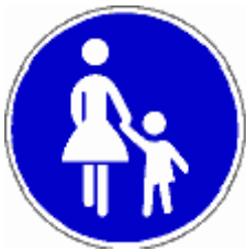
(Zeichen 239: Fußgänger).

Als nächstes Gleichstellungsziel sind nämlich die Verkehrszeichen dran. Da könnte man Gleichstand zwischen eckigen männlichen und gerundeten weiblichen herstellen. Auch hier bedeutet Gleichstellung dann Gleichverteilung. Einseitig sind da besonders die Verkehrszeichen 239 bis 243, die alle dieselbe Frau mit Kind darstellen: